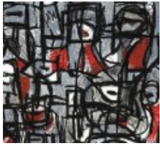
Habitat (détail) , 2016 Collagraphie, pastel à l'huile marouflé sur bois (série de 27 éléments) 25 x 20 cm (chaque élément)